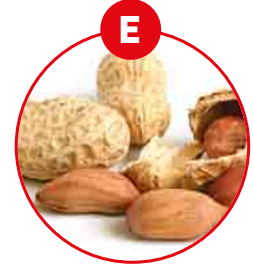
E YER FISTIĞI