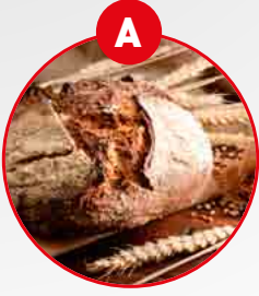
A GLUTEN İÇEREN TAHILLAR