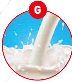
G SÜT VEYA LAK- TOZ