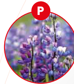
P ACI BAKLALAR