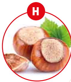
H FRUITS À COQUE