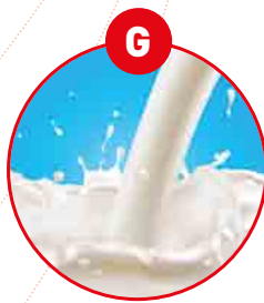
G LAIT OU LACTOSE