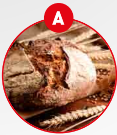
A CÉRÉALES CONTENANT DU GLUTEN