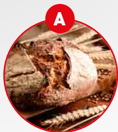
含有面筋蛋白的谷物